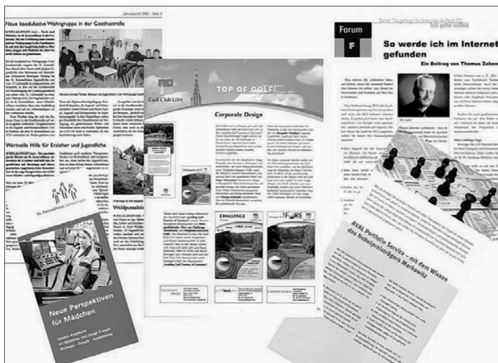
Broschüren, Jahresberichte und Beiträge für Fachmagazine mit Texten von profitextulm: Öffentlichkeitsarbeit kennt viele Formen.